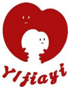
图2 团队标志 (logo)

在营销推广方面,团队采用了多渠道、多维度的策略。一方面,通过社交媒体平台发布产品创意设计和留守儿童的公益故事,吸引社会公众的关注与参与;另一方面,与高校社团、公益组织及景区联合开展主题宣传活动,如冰雪文化创意展、橡皮章慈善拍卖等,进一步提升品牌知名度和影响力。