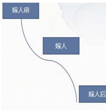
琵琶女人生轨迹图