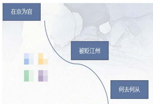
白居易人生轨迹图