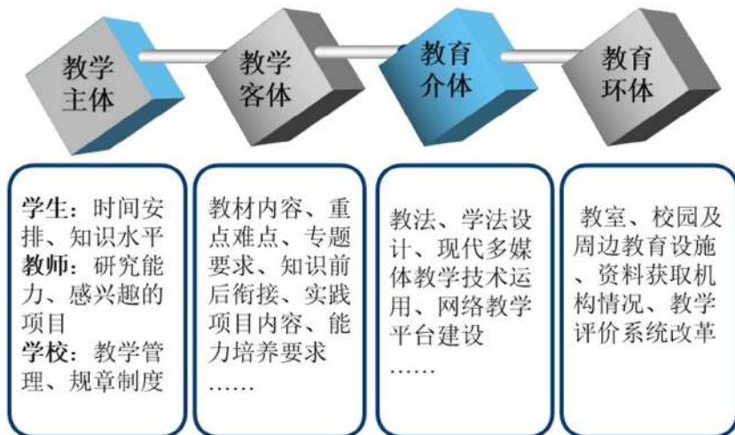
图1《地理学科教育前沿专题》教学系统的组成

(1) 就学科教学(地理)专业《地理学科教育前沿专题》教学系统而言,其组成包括:教育主体(学校、教师和学生)、教育客体(《地理学科教育前沿专题》知识系统)、教育介体(教法、教具等)以及教育环体(教学评价系统、教学设施系统等)(图1),其核心是人(教师和学生),其主观能动性决定了行为的不确定性,通过教学环体创设,能够引导学生更快的掌握教育前沿问题。