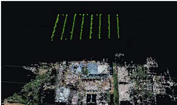
图 1 无人机航摄轨迹图

根据建设审计工程项目的具体施工实况和现场要求,选定了大疆精灵 4pro 无人机搭载 DJI FC6310S 相机(感应器尺寸 13.2mm,焦距为 8.8mm)构成审计作业平台。在航测时,为满足任务的精度要求,航向重叠率设置为 80%,旁向重叠率设置为 80%,有效高度设置为 100m,分五个任务完成此次航测的拍摄任务,其航摄轨迹如图 1 所示。