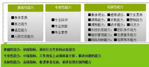
图1 三大素质能力培养板块示意图

构建学生活动项目化管理模式。定期启动申报工作,由学生自主建立项目团队,在教师的指导下自主设计活动方案,通过项目申报、项目答辩、学生活动组织开展、活动效果反馈评估等环节来完成,从而达到推动学生综合能力培养的目的。(图2)