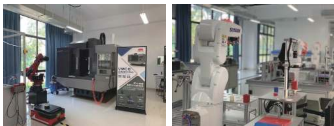
图 1 工业机器人专业实训设备一角

工业机器人技术专业是典型的工科专业, 以智能电气装备、工业用机器人、各类机械手等设备为媒介, 培养服务于制造自动化领域的技术技能型人才的一门学科。2015 年, 教育部结合市场需求和战略要求, 修订了高职(专科)专业目录及其专业设置管理办法, 将“装备制造大类”替换了原来的“制造大类”, “工业机器人技术”等新型专业设置在“装备制造大类”之下。工业机器人技术专业包含有《工业机器人在线编程》《工业机器人操作与运维》等专业课。