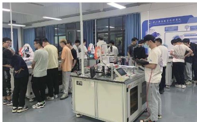
图 2 学生按团队学习实践

践时间。且在面对这类训练, 学生在实操中仅仅培养了操作机器人的能力, 对于机器人内在的控制方式、结构设计等理解不深刻。因此, 探索一种将工业机器人技术专业各类课程进行强结合, 充分发挥学生主观能动性, 提高学生动手实践能力的课程体系十分必要。