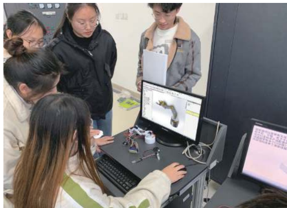
图 4 学生在将工业机器人实物和 3D 模型做对比

本文探索以微小型 3D 打印的工业机器人为载体, 探索构建工业机器人技术专业课程体系, 并初步尝试了将该机器人应用于教学, 培养学生动手实践能力。发现学生积极性明显提高, 学习目的性增强, 具有较好的教学效果。且该机器人制作成本低, 外形精美小巧, 便于学生操作学习, 也便于在实训室大量配置使用。依托该机器人将工业机器人技术专业课程之间的知识点桥接, 学生能够快速深刻的建立完整工业机器人技术知识体系。