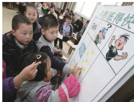
图4 间接补充记录图