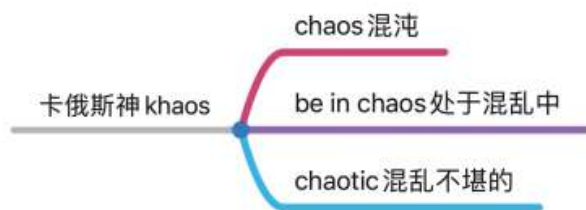
图1 古希腊神话人物 - 卡俄斯单词

卡俄斯 (Khaos) ——混沌之神。是古希腊中最古老的神明, 是指创世前的那片混沌, 卡俄斯就用来表示虚空、混沌的意思。拉丁语中把卡俄斯写作 chaos, 后来这个词直接被英语拿来用于表示混乱的意思。在英语中, 有关 chaos 的常用短语有 be in chaos 表示处于混乱之中, 例如 The forest was in chaos after the typhoon 台风过后, 森林变得一片混乱; 同时, chao 作为词根, 加以形容词后缀 tic, 形成 chaotic 表示混乱不堪的, 例如 The traffic in the city is chaotic in the rush hour 在上下班高峰, 城市的交通混乱不堪。