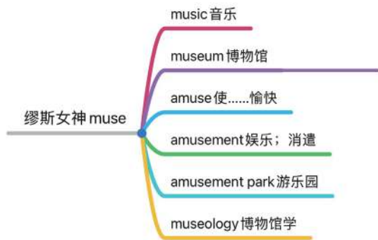
图 3 古希腊神话人物 - 缪斯单词

缪斯 (Muse) —— 艺术之神。缪斯在古希腊神话中是掌管科学与艺术的九位女神的总称, 缪斯女神流淌着艺术的血液, 她们总是出现在众神和英雄们的聚会上, 热衷于给那些有艺术细胞的人们带来灵感, 因此, 在英语词汇中, 以缪斯女神 Muse 的名字为词根的词或多或少都带有音乐的元素。例如, 英语单词 music, 就是 Muse 去掉不发音的字母 e, 再加 ic 后缀形成的, 意为音乐; museum 博物馆; amuse, a 是英语中动词的前缀表示加强, muse 衍生娱乐消遣之意, amuse 就意为使……愉快; amusement 则是再加以名词后缀 ment, 意为娱乐、消遣; amusement park 为游乐园; museology 则为博物馆学。