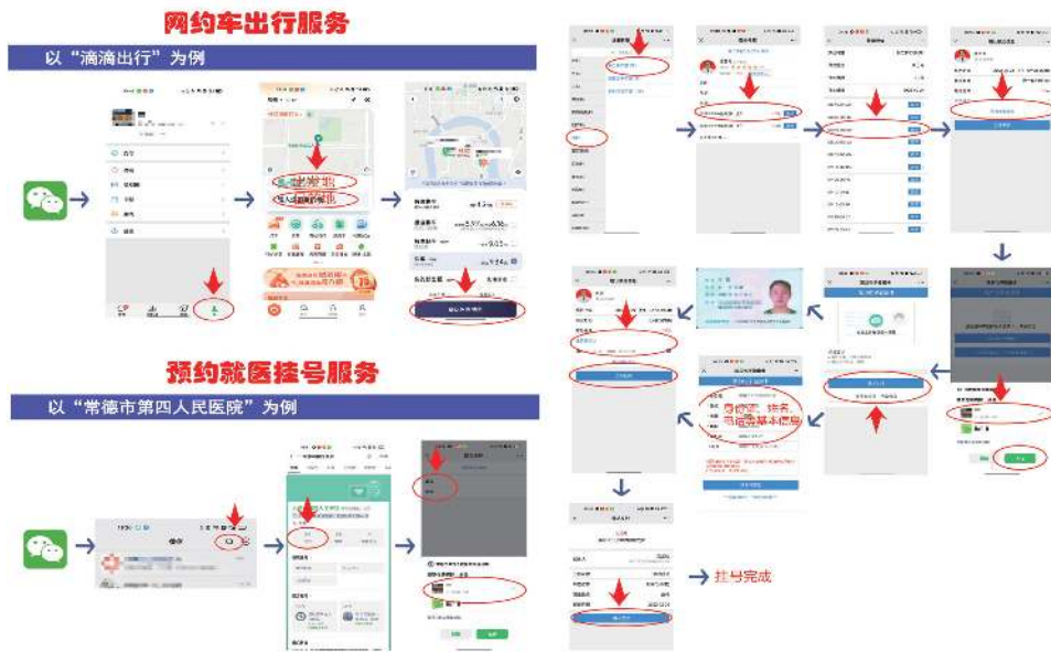
图 3 网约车出行服务、预约就医挂号服务

当前数字信息社会对老年人特别是农村的老年人是很不友好的。他们的子女在外务工，自己独自生活。日常还好，当遇到特殊情况的时候，一些问题就很容易显现出来。目前政府花大力气做到了城镇乡村网络全覆盖，推出了很多便民举措。但老年人由于各种各样的原因导致一些原本很便捷的服务无法覆盖这个群体。老年人不应该成为“掉队”人员，老年人的日常生活也不单单是某一个家庭的事情。我们需要政府发挥主导作用、加强科普，建立全面、立体的可保障老年人健康和生活的措施。