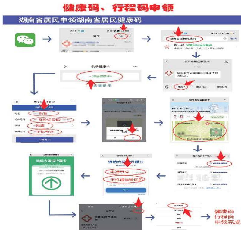
图1 健康码、行程码申领

目前健康码和行程码是我们普罗大众出行、购物、就医等日常生活必不可少的“朋友”。相信大部分老年人已由亲朋好友告诉如何申领健康码与行程码。但考虑到老年人的忘性及公众号被聊天淹没等找不到健康码的情况,本套手册优先向老年人介绍如何申领健康码、行程码,以及如何置顶健康码。手册设计如图1所示。