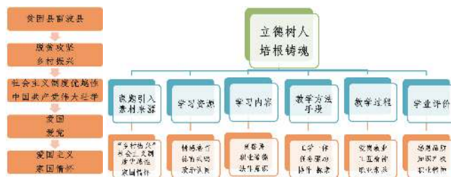
图2 本次学习任务课程思政设计思路图

摄和店铺的注册。货品上架之前, 由于需要对网店进行设计与装修, 需要首页焦点图、商品详情页、底部导航、自定义页面等。但是青杠村提供的照片由于拍摄技术、设备和天气等原因, 同时也出于电子商务网站中的图像能否正确反映商品的真实颜色至关重要等方面的考虑, 需要先对图片进行处理。所以本次课程就以处理图片-调色(亮度和饱和度)作为一个微任务进行教学。