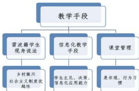
图5 教学手段承载的思政教育目标

合理的教学手段,有助于学生的参与、体验,从而提升学生对情感、态度、价值观的接受度。本次课程,我安排了雷波籍学生现身说法,讲述脱贫攻坚和乡村振兴带给家乡翻天覆地的变化,通过今昔对比讲述,激发全班同学的爱国热情和家国情怀,感受中国共产党的伟大壮举和社会主义制度的优越性。借助信息化的教学手段如QQ群、公众号、APP等,建立线上线下课程思政教学模式,开展学生乐于接受、乐于参与的教学活动,增强课堂教学的思政效果,同时培养学生的信息化应用能力。通过课堂管理进行价值引领,也是我采用的一种教学手段,以学生违反课堂纪律为切入点,引导学生形成正确的是非观、遇到问题时友好沟通的重要性及正确处理问题的方式,在做人做事方面进行正确价值引领。并纠正学生的不良行为习惯。本次课程,教学手段承载的思政教育目标如图5所示。