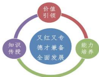
图1 课程思政教育理念

本次课的教学对象是技工院校二年级学生, 他们思维活跃、动手能力强, 年龄分布为16-18岁, 学习自觉性欠缺, 文明素养、行为习惯等需要加强引导, 学生的团队意识、职业精神、社会责任感较弱, 因此, 将思政教育融入专业课教学是非常必要的。我的课程思政教育理念如图1所示。