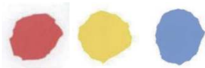
图一 《小蓝和小黄》绘本图片 1

师：同学们从东京奥运会的赛场上发现了色彩可以表达情感。进入新学期，“色彩”是我们要重新认识、深入了解的一种绘画语言。今天我要带着大家进入另一个世界看一看，这个名字叫作二维世界，你们听说过吗？