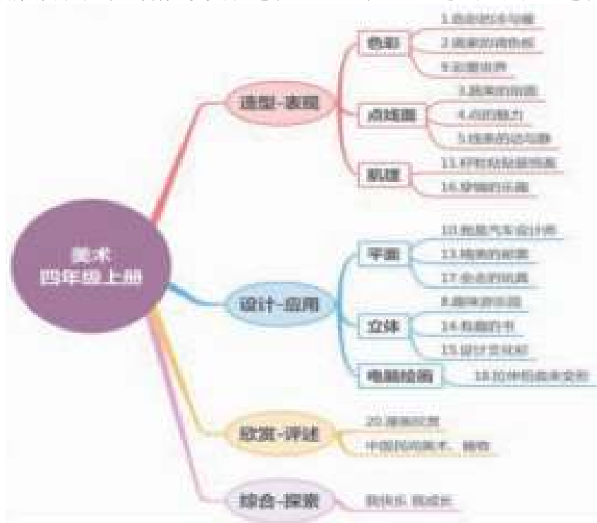
图七 鲁教版四年级美术上册教材梳理思维导图

师：在新的学期重新认识色彩是一段有趣的航程，《色彩的冷与暖》《画家的调色板》和《彩墨世界》是航程中“参观”色彩的重要景点。当然，除了色彩还能“参观”点线面、肌理等等。