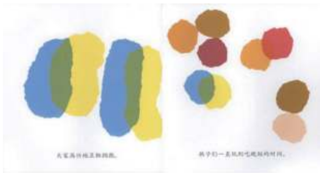
图二 《小蓝和小黄》绘本图片 2

师：项目最多的三名运动员是小红、小黄、小蓝，他们在三年级第一课《魔幻的色彩》中也出现过，同学们还记得吗？