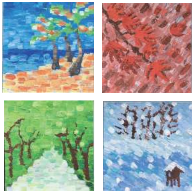
图三 色彩构成——春夏秋冬

项目二：师：下列三张图中有多个色块，你能按照色彩的冷暖给这些色块排序吗？请这位同学把相应的序号挪动到色块上完成排序（最冷的颜色标序号 1。）