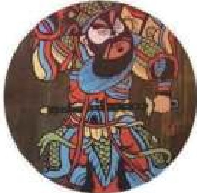
图五 《门神》(木版年画)