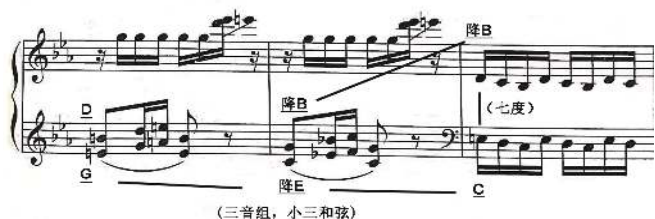
图 3 第 35-37 小节

段落 c 为技巧型段落，右手以快速的重复八度强奏为主，左手以音束为主，依旧是围绕着“G 角音”所展开的写作。接下来的段落 d 的音乐取材来自“布老虎”与“木偶人”主题素材，两个主题以片段出现的形式结合在一起，而在调性上也呈现出较为精心的设计。