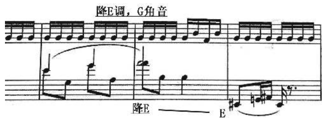
图 2 第 29-31 小节

此处也是前奏曲中第一次开始出现调性变化的地方。左手转为 E 调，右手维持原调降 E 调，双手调性呈七度关系行进直至段落 c 开始第 31 小节才回到统一的原始降 E 调性，如图 2。