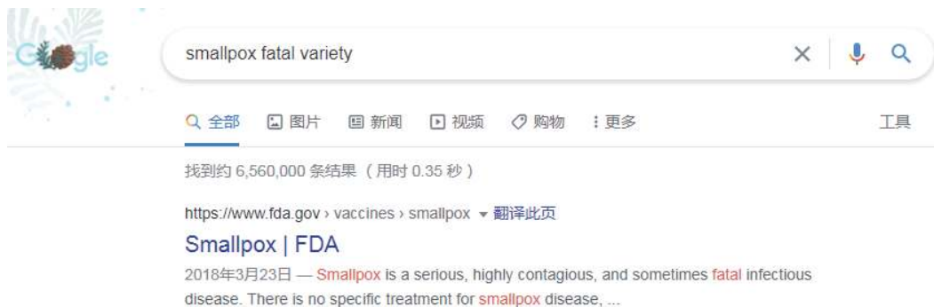
图2 以“smallpox”“fatal”和“variety”为关键词的部分检索结果

欲提升搜索结果,需要在文段内容中寻找更有价值的关键词。例如:排在第一的检索结果,大致说明了大多数曾经罹患天花的患者存活。然而,有一些种类的天花非常致命,并且针对对象通常是孕期妇女以及免疫系统受损的人。而成功存活的患者也有很大几率会在脸上、手臂或者腿上留下瘢痕。