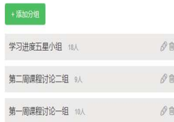
图 4 按需分组, 按小组评价

添加分组后, 前往学生管理, 可将学生按照一定的组织方式分配到不同的组, 分组后学生成绩管理及学习数据统计等即可按照该分组查看。