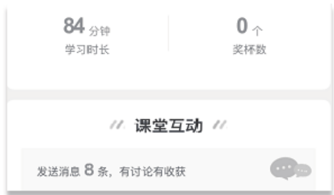
图 3 单个学生的课堂学习数据

其次, 从课堂互动情况来看, 在线课堂更能激发学生参与的欲望, 后台数据显示在直播课中, 平均每节课有 20 多人举手提问, 100 多次的弹幕, 对于中职学生来讲, 这在传统的线下课是不可想象的, 个别同学成绩线下排名长期垫底, 不愿在课堂表达