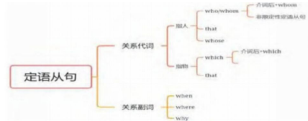
如图 1 定语从句语法拓展思维导图

作为语言规则的有效总结, 语法是学生学习英语过程中的重难点内容, 通常随着抽象、枯燥、难理解的特点, 因此建议巧妙应用思维导图, 通过引导学生建立系统性语法框架图的形式, 提高语法复习的效率和质量, 即要在关系紧密的网络系统中, 填充看似孤立且零散的语法点, 确保学生大脑皮层能够建立清晰且完整的英语语法脉络图。例如, 以定语从句语法拓展为例, 在实际步入复习阶段, 需要从定语从句的基本结构构建入手, 让学生精准识别、高效判断阅读或做题环节的从句类型, 教师在明确构建定语从句框架图的教学目标后, 结合 PPT 课件, 以例句展示的方法, 带领学生共同完成定语从句框架结构的总结工作, 然后帮助学生树立不断填充框架分支内容的意识, 以下图 1 为例, 就是笔者与学生共同进行定语从句扩展教学期间, 所应用的思维框架图, 由于该知识内容属于语法拓展内容, 所以笔者没有要求学生必须进行思维导图的自我绘制, 此项练习笔者将会在后续学习相关内容时带领学生重点练习。