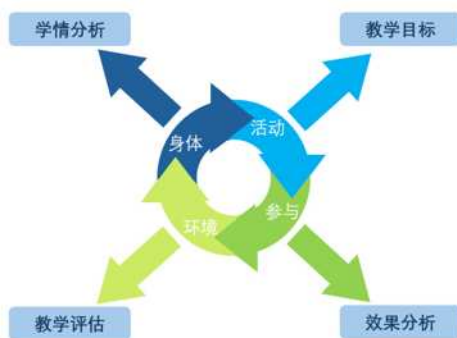
图 2 ICF 框架在教学中的应用

在《特殊儿童作业治疗》的教学过程中, 我们紧密适配 ICF 框架的核心理念。通过学情分析明确教学目标, 将 ICF 的评估方法、治疗原则融入教学内容, 设计多样化的教学活动以增强学生的实践能力。同时, 创设相关教学环境, 营造积极氛围, 并运用 ICF 框架指导教学实施与评估。此外, 我们还注重挖掘课程中的思政元素, 引导学生内化责任感、同情心等品质, 建立教学反馈机制, 不断优化教学, 提升教师专业素养(见图 2)。