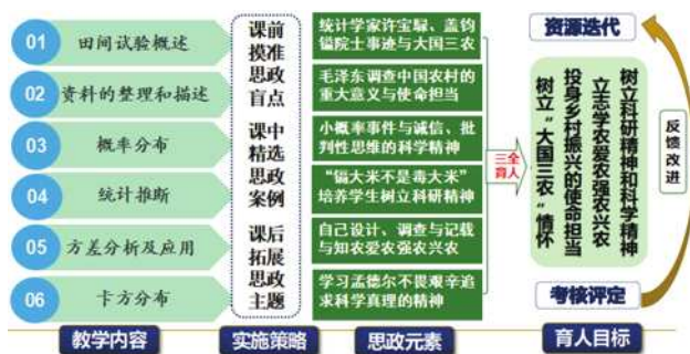
图1 园艺试验与统计学课程思政实施策略及育人目标

“多维一体”的课程目标,充分发挥课程思政的感染力、价值力、吸引力,解决价值引领不足的问题(图1) [2] 。