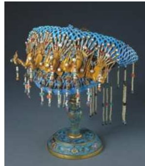
左图为银镀金珠石累丝指甲套,右图为清点翠嵌珠宝五凤钿(均为清制)