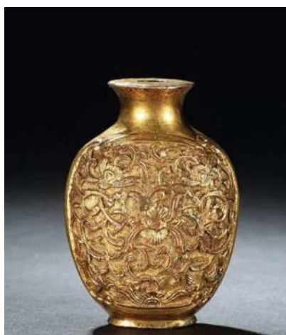
APEC国礼：《和美》纯银丝巾果盘

篆刻，鼎盛于战国时期，在金银材料上使用凿纹，制作方法为凿、雕。篆刻对工匠的综合素质要求很高，工作过程相对复杂，技术难度大。