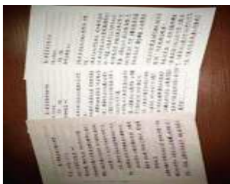
图2 19年春季学期—19年秋季学期访谈调查

但从数据上(表4)分析看出，仍然有学生没有达标。通过投影改进分析得出，学生DMU21由于活动课堂表现过于活跃，影响了英语学习效果。DMU1该生成绩在下一年度活动中提高27%，才可达成预定教学目标。