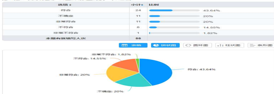
图1 学生对活动质量的满意程度

统计调查问卷数据发现，55位有效填写调查问卷的学生中，63.64%（35位）的学生对2019年活动的质量较为满意。学生以“直观、简洁、方便、高效、新颖、