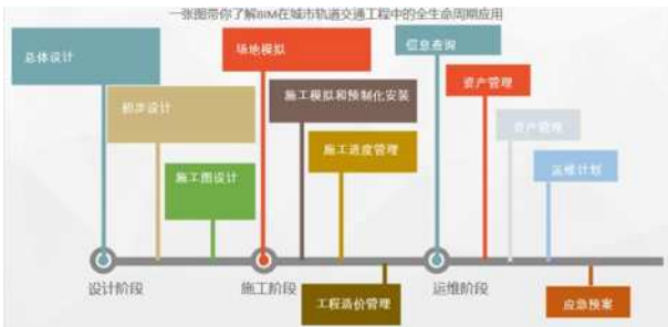
图 1 BIM 在城市轨道交通工程应用图示