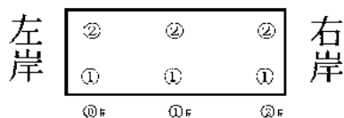
图1 1#临时桥灌注桩钻孔顺序图

1#临时桥桩基施工前先将河道左岸（0#~1#）和右岸（2#墩）的桥梁投影区域下进行筑岛围堰。施工0#1#2#墩灌注桩，采用3台CZ-90冲击式钻机同步对0#1#2#墩的上游1号桩基施工，根据1#临时桥桩基施工区域的地质情况并结合钻机施工性能，预计2020年11月1日（18天）完成0#1#2#墩的上游1号桩基成孔、钢筋笼绑扎及混凝土浇筑工作。1号桩基施工完成后及时将钻机移至2号桩位上，3台CZ-90冲击式钻机同步对0#1#2#墩的下游2号桩基进行施工，预计2020年11月19日（18天）完成0#1#2#墩的下游2号桩基成孔、钢筋笼绑扎及混凝土浇筑工作。待14天后（即2020年11月26日）进行基坑开挖、凿桩头、桩基检测，桩基检测合格后即可依次进行连梁、墩柱及盖梁、桥台等施工。图1为1#临时桥灌注桩钻孔顺序图。