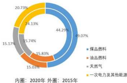
图2 2015年与2020年能源消费结构对比

从我国的能源消耗类型来看，在2020年，全国能源消耗中，以煤为主，达到44%以上。某市通过加大对煤耗的控制力度，大力发展清洁的天然气和电力等清洁能源，促进石油产品品质的提升和能源消费的不断调整。2015~2020年度，全国煤耗比重从49.07%降到44.29%、15.83%、15.83%、15.17%、15.74%，一次电量和其它能源分别从20.73%增至24.13%。