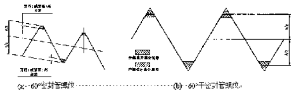
图3 管螺纹牙顶高和牙底高的公差带分布位置对比图

而与其相似的螺纹且自身具有可靠密封性能的螺纹，应为《GB/T 27944-2011 60°干密封管螺纹》，其“适用于对螺纹密封性能有较高要求的管子、阀门管接头及其他管路附件的螺纹连接”。从其公差带分布（图3(b)）可知，外螺纹牙顶与内螺纹牙底、外螺纹牙底与内螺纹牙顶均为过盈配合，螺旋旋紧后螺纹副实现了真正的“无缝”联结，有效地保证了螺纹密封 [3] 。