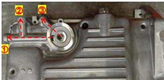
图 1 机油盘典型油路结构

下图是一个典型的机油盘，为了实现机油泵、缸体主油路、机油滤等油路的加工，需要加工 3 个工艺孔，安装 3 个工艺螺堵。