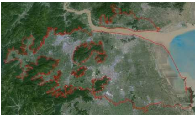
图 1 台州市航摄范围图

面状摄区选择位于中国浙江省沿海中部, 陆地面积 9411 平方千米, 此试验区比较典型为中间有几处海拔较高的山峰, 局部区域高差较大, 如选择较高的相对航高, 则在平地区域的点密度较稀疏, 影像分辨率较低, 选择较低的航高, 山区部分需要另外分区, 因此需要划分最合适的分区和布设最经济的航线。摄区范围如图 1 所示, 红色范围线内区域为航摄有效范围: