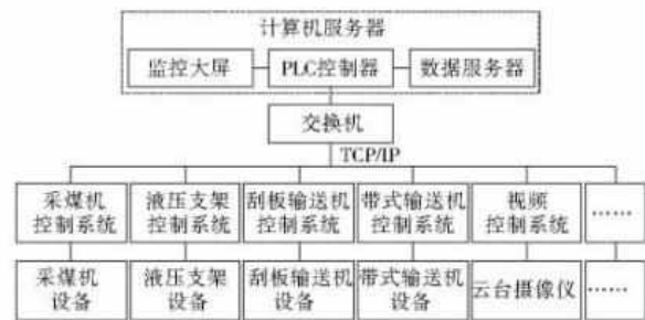
图1 工作面智能化管理系统整体方案

智能化的管理系统，对于深入分析煤矿的综采工作给予了实质性的帮助。智能化系统的介入使整个管理系统网络得到了有效划分，分别针对综采工作进行了采煤设备、单个设备及计算机智能化集中等相应的设备措施给予支持。采煤设备包括常见的采煤机之外，还运用其水泵、通风机作为相应的辅助设备来推进采煤工作。