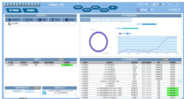
图1.集团安全监测系统

随着国家对煤矿安全生产的重视，与之相关的管理规定、条例陆续颁布实施，我国各型煤矿都安装和完善了本企业的安全生产监测系统，并依照《煤矿安全规程》（总局令第87号文件）对安全监测监控系统所具备的功能进一步划分，主要用于监测通风系统的运转状态，实时采集井下各种重要参数，通过智能化分析，发现通风系统潜在性问题，做到精准定位，查清原因，快速施策。