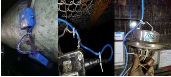
传感器二次保护图片

(2) 各单位有计划进行断线、倒传感器、标校及日常维护等作业造成数据传输中断时，必须提前 1 小时填报“计划内运维”模块，确认生效后，现场方可进行操作；为避免人为原因导致传感器虚接、航空接头松动造成多次传输中断，各单位要对传感器接线处及航空接头进行二次保护。