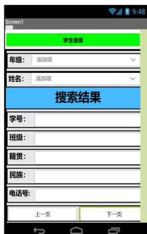
图 2 学生信息