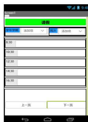
图 4 请假