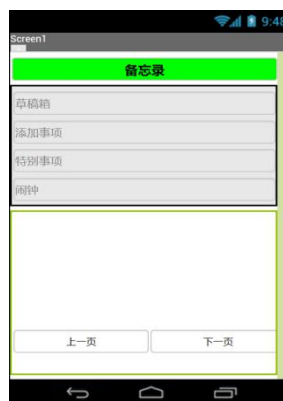
图 3 备忘录