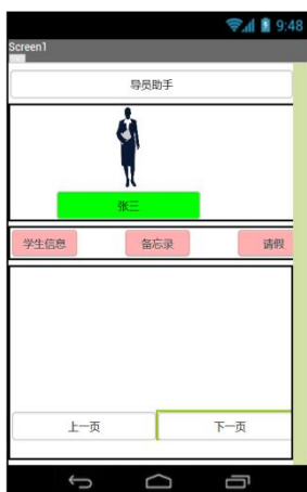
图 1 主页