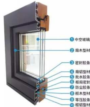
图2 门窗节能施工技术

建筑物的门窗经过科学设计,选用合适的材料,兼顾当地气候、自然条件和具体技术条件。分析门窗的防风效果和雨水渗透效果,科学设计立面的形状、尺寸和参数条件,用于抵御寒冷、风暴的影响。使用节能环保技术在建筑施工中的应用,包括连接窗框和窗洞口的断桥节点处理技术。将铝合金隔热窗安装在外窗上,并安装密封胶条,在一定程度上减少气流,起到吸收冷空气和散热的作用。采用单面镀膜低辐射玻璃,其隔热性能优良,安装光、温度传感器,通过在建筑物南侧和西侧安装外部遮阳装置来减少太阳辐射,并根据室内外温度和太阳辐射提供自动调节百叶窗的智能技术,如安装外置卷帘、外置钢化玻璃百叶窗(冰花玻璃)等。