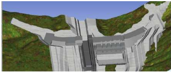
混凝土坝分项工程某时刻施工面貌