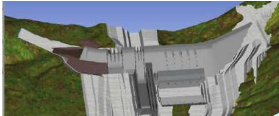
土石坝分项工程某时刻施工面貌