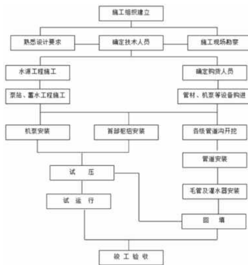
图1 水利工程施工的过程

管理技术,从而体现出社会经济的效益。加之中国地形比较复杂,气候的变化也比较大,经常存在水灾的问题,这样一来,对人们的人身财产安全产生一定的影响 [3] 。水利工程项目的建设能够避免发生的水灾问题,与此同时还会对水利工程带来一定的影响,水利工程项目施工的过程如下图1所示。水利工程项目主要是为人民而服务的,并且需要确保长期的发展,对水资源的管理工作,能够有效地避免在工程项目建设中发生的一些问题。在开展操作工作过程中需要按照相关标准进行工作,这样一来才能够提高相关管理工作的质量。 [4]